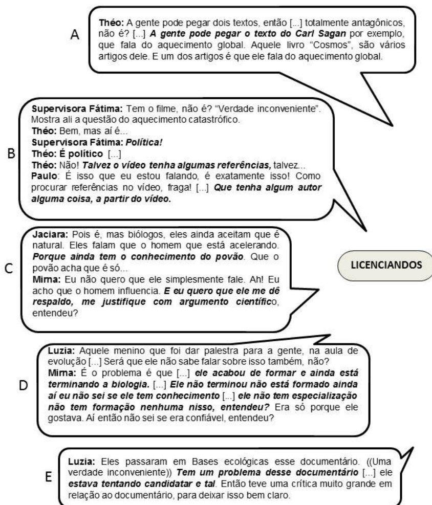
FIGURA 3: Pontos de vista dos licenciandos sobre a participação de leigos, cientistas e políticos na gestão da controvérsia do aquecimento global.