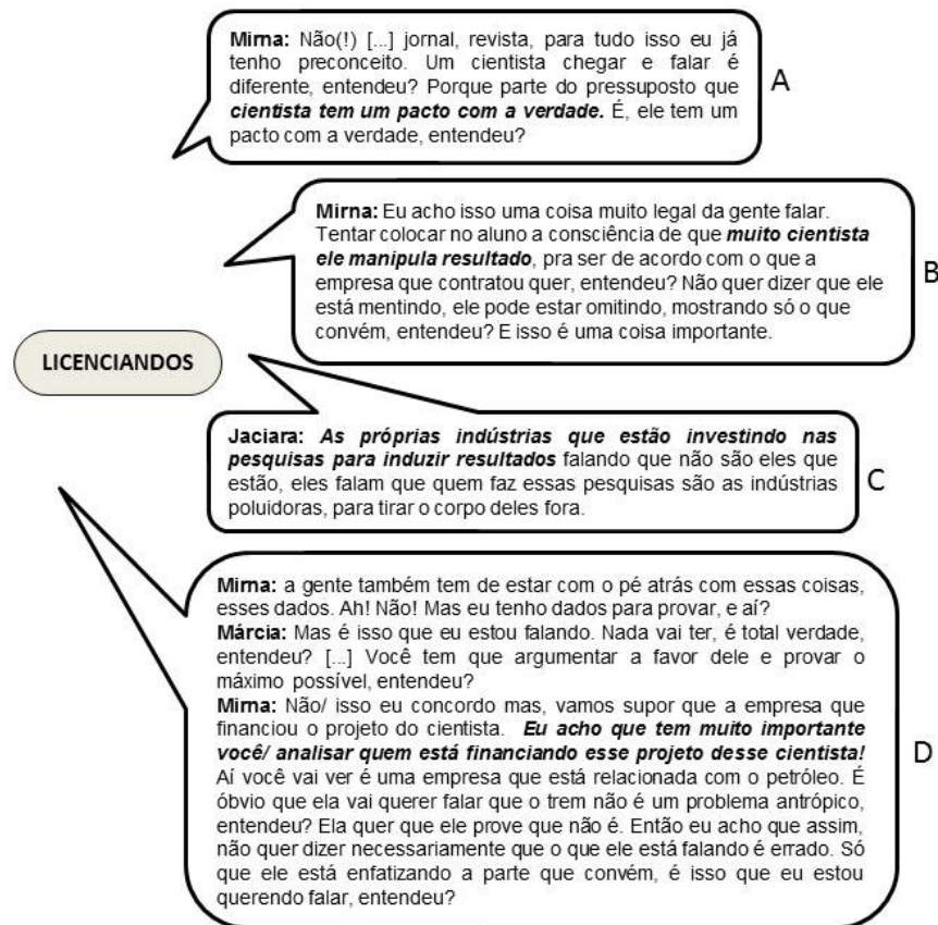
FIGURA 1: Pontos de vista dos licenciandos sobre o cientista e fatores que influenciam o trabalho do cientista.

podem ser importantes para a formação do cidadão e a construção de mundos possíveis. Têm o cuidado de buscar fontes de informação confiáveis. Em algumas situações demonstram uma visão ingênua do cientista, como alguém que tem um pacto com a verdade (ver transcrições na FIGURA 1, A). Identificam os fatores que influenciam a resolução de uma controvérsia, tais como a manipulação de dados científicos e o financiamento de pesquisa (ver transcrições na FIGURA 1, B, C e D, respectivamente).